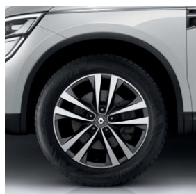
Aluminijski naplatci 18" Argonaute