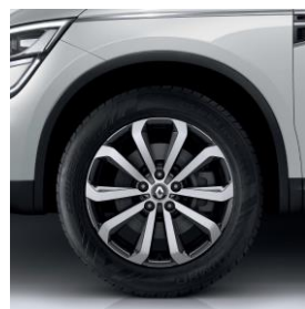
Aluminijski naplatci 18" Taranis