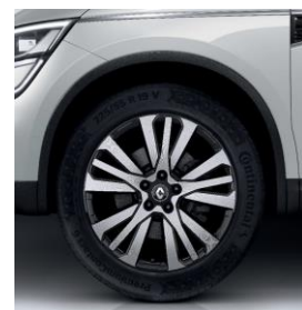
Aluminijski naplatci 19" Initiale Paris