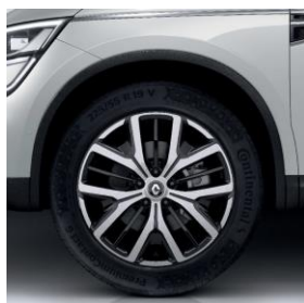
Aluminijski naplatci 19" Proteus