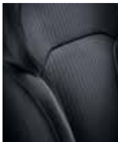
Tamnospive presvlake (svjetlosivi prošiv)