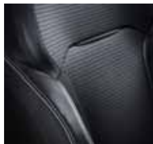
Tamnosive presvlake od tkanine BOSE u kombinaciji s umjetnom kožom