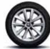
Aluminijski naplatci 16" Silverline