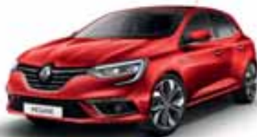
Crvena Flamme (MB-P)