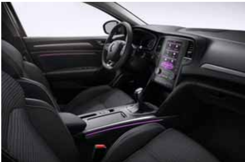
Slika prikazuje opcijску opremu