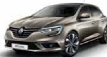
Bež Dune (MB)**