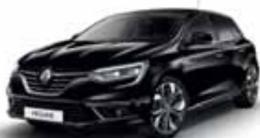
Crna Etoile (MB)