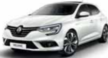
Perla bijela (MB-P)