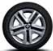
Čelični naplatci 16" Flexwheel s ukrasnim pokrovima Complea