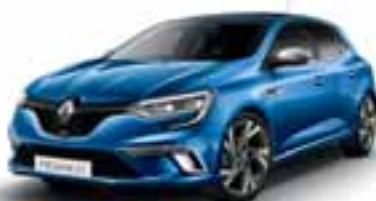
Plava Iron (MB-P)*