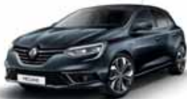
Siva Titanium (MB)