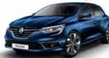
Plava Cosmos (MB)**