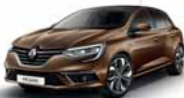
Smeđa Capuccino (MB)**