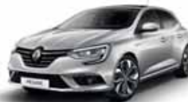
Alu siva (MB)