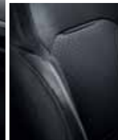
Tamnospive presvlake u kombinaciji s umjetnom kožom