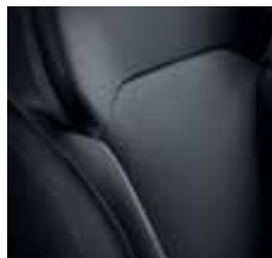
Tamnospive presvlake (s neutralnim prošivima)