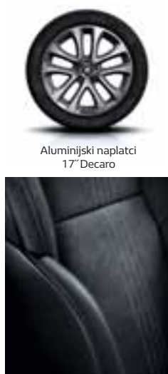
Aluminijski naplatci 17" Decaro