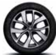
Aluminijski naplatci 17" Celsius