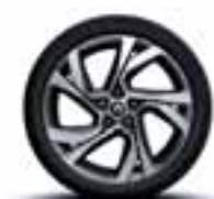
Aluminijski naplatci 18" Magny-Cours