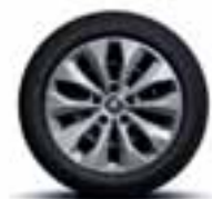
Čelični naplatci 16" Florida