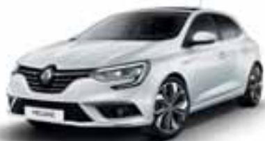
Ledeno bijela (NB)