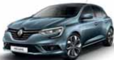
Plava Berlin (MB)