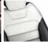
Presvlake od Nappa kože u kombinaciji svijetle i tamne boje