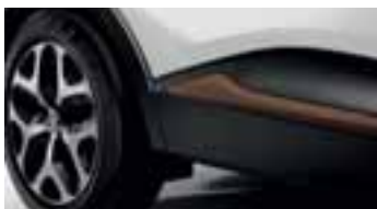
Paket LOOK VANJSKI IZGLED - Cappuccino