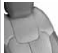
Preslake u kombinaciji umjetne kože i svjetlosive boje