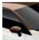
Krov u boji smeđa Cappuccino (PE)