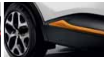
Paket LOOK VANJSKI IZGLED - Narančasta