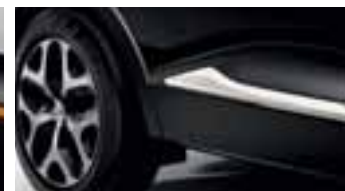
Paket LOOK VANJSKI IZGLED - Boja bjelokosti