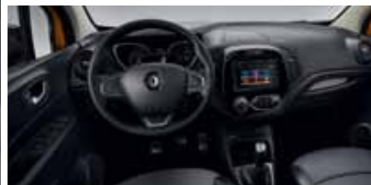
Paket LOOK UNUTRAŠNOST - Krom