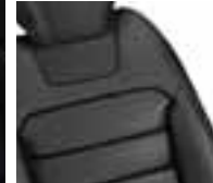
Presvlake od Nappa kože u crnoj boji