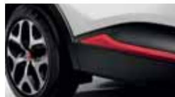
Paket LOOK VANJSKI IZGLED - Crvena