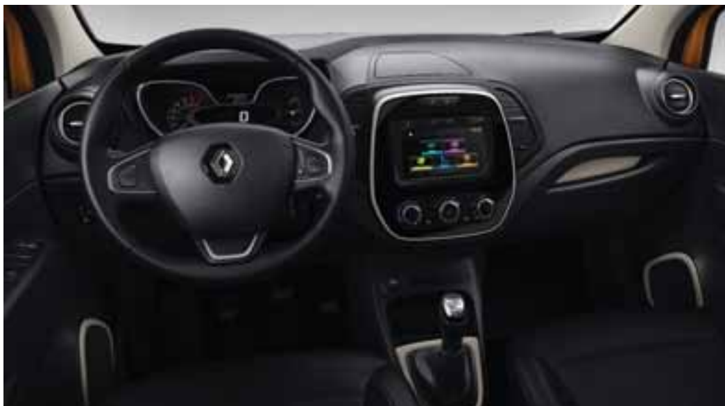
Unutarnja oprema u kontrastnim bojama