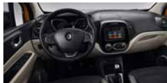
Unutrašnjost u kombinaciji svjetle i tamne boje