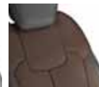
Preslake u kombinaciji umjetne kože i svjetlonarančaste boje