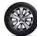
Aluminijski naplatci 16" Adventure