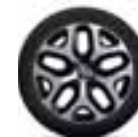
Aluminijski naplatci 17" Emotion - Crna