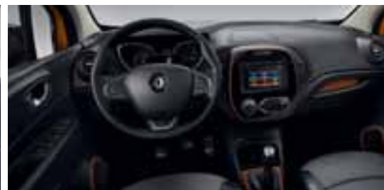
Paket LOOK UNUTRAŠNOST - Narančasta