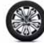
Aluminijski naplatci 17" Initiale Paris