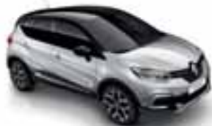
Siva Platine (PE)* Krov crna Étoilé (PE)