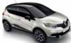
Boja bijelokosti (NL)* Krov crna Étoile (PE)