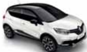
Perla bijela (PE)* Krov crna Étoile (PE)