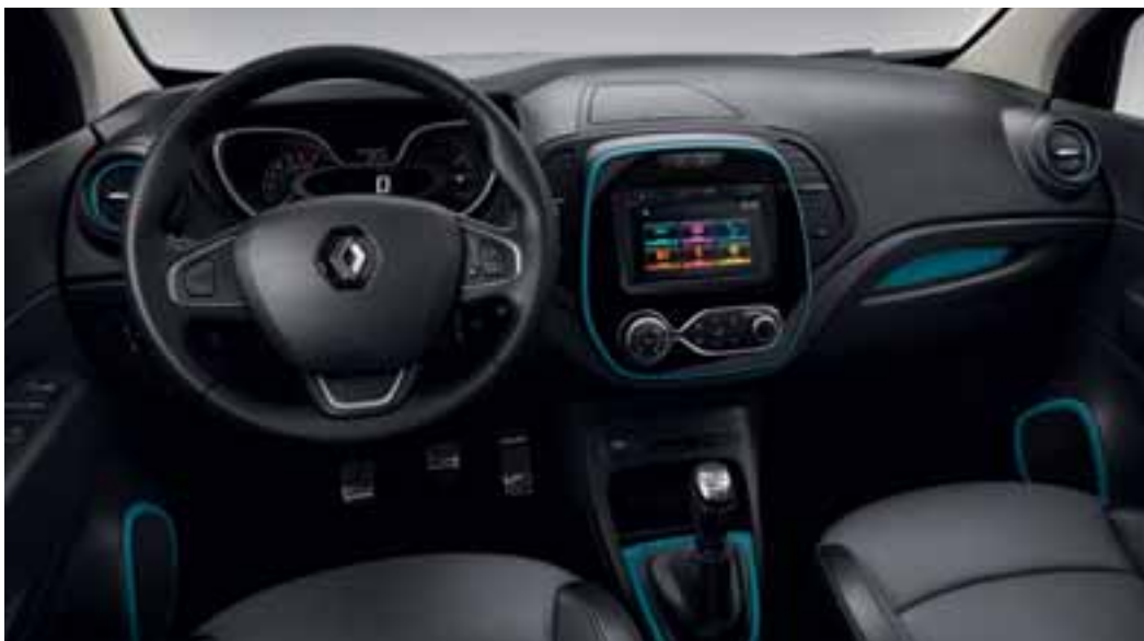
Paket LOOK UNUTRAŠNOST - Plava