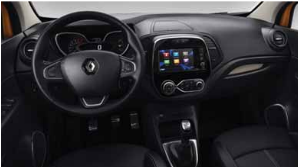
Unutarnja oprema u kontrastnim bojama