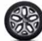
Aluminijski naplatci 17" Emotion - Siva