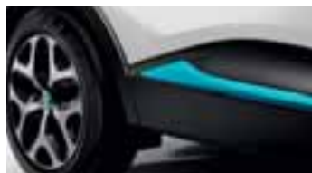
Paket LOOK VANJSKI IZGLED - Plava