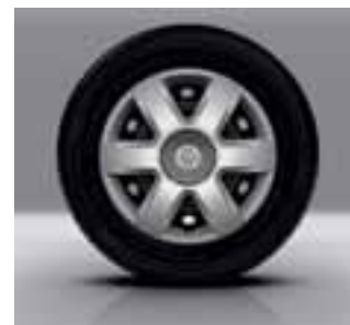
15-inčni ukrasni poklopci Brigantin

Volan podesiv po visini Stražnja klupa preklopiva u ravnu podnicu u omjeru 1/3-2/3 Sustav za pričvršćivanje dječjih sjedala ISOFIX na stražnjim bočnim sjedalima Prekrivalo prtljage Djelomične plastične obloge u teretnom prostoru Funkcija za ekovožnju Rezervni kotač standardnih dimenzija Ostakljena desna klizna vrata Fiksna stijena s prozorom umjesto lijevih kliznih vrata Ostakljena podizna stražnja vrata Brisač stražnjeg stakla Grijano stražnje staklo Tonirana stražnja stakla Električna, grijana vanjska osvrtna ogledala mat crne boje Crni odbojnici 15-inčni kotači s disk-kočnicama na svim kotačima