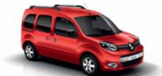
CRVENA VIF (JB 719)