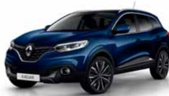
Plava Cosmos (MB)