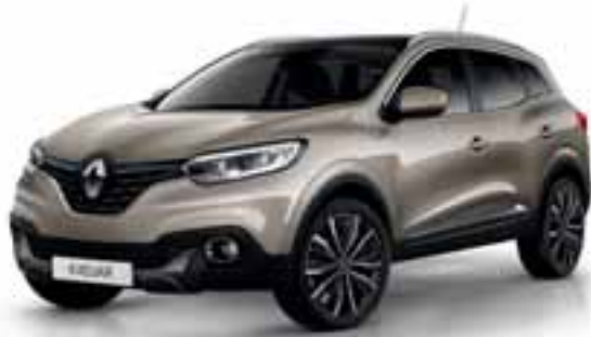
Bež Dune (MB)