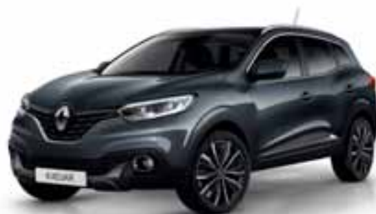
Siva Titanium (MB)