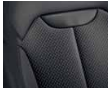
Presvlake od tamnosive tkanine