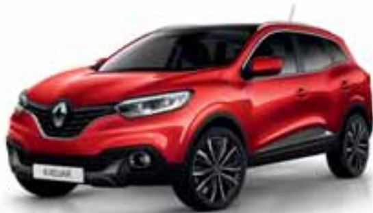
Crvena Flamme (MB-P)