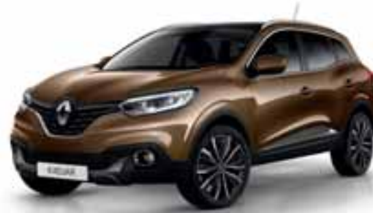
Smeđa Cappucino (MB)