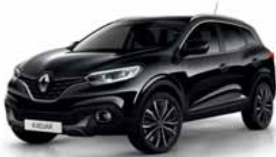
Crna Étoilé (MB)