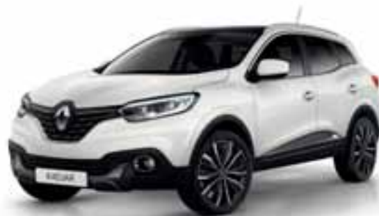
Perla bijela (MB-P)