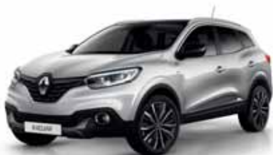
Platinasto siva (MB)