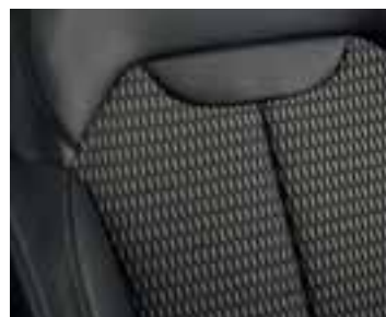
Unutrašnjost crne boje u kombinaciji s crnom kožom