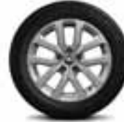
Aluminijski naplatci 17" Aquila