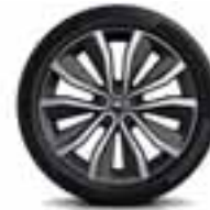
Aluminijski naplatci 19" Egeus