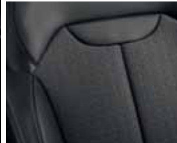
Crna unutrašnjost u kombinaciji s crnom kožom