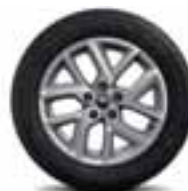
Alumijski naplatci 17" Impulsion