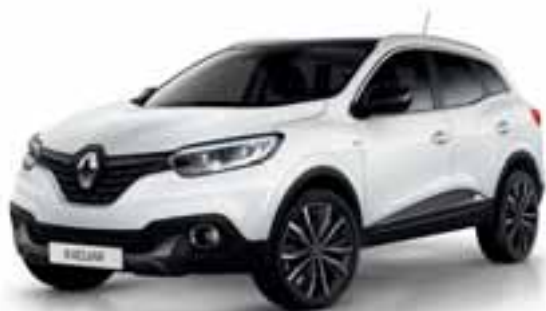
Ledeno bijela (NB)