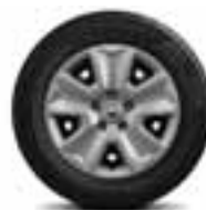
Čelični naplatci 16" s ukrasnim pokrovima kotača Pragma