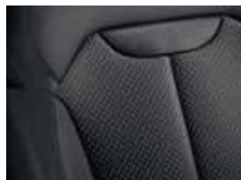
Presvlake od tamnosive tkanine