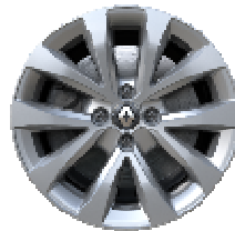
16" aluminijski naplatci Philia u srebrnoj boji