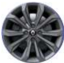
16" aluminijski naplatci R.S. Line Boavista