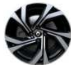
17" aluminijski naplatci R.S. Line Magny-Cours