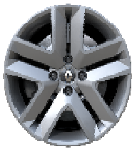
Ukrasni pokrovi kotača Amicitia 16"

Važno: Moguće kombinacije su opisane kod PERSONALIZACIJE