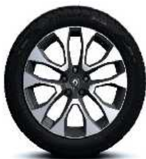
Aluminijski naplatci 19" Proteus