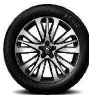
Aluminijski naplatci 19" Initiale Paris