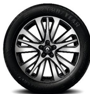
Aluminijski naplatci 19" Initiale Paris