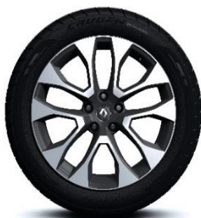
Aluminijski naplatci 19" Proteus