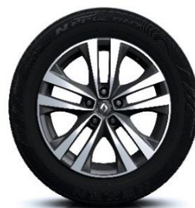
Aluminijski naplatci 18" Argonaute