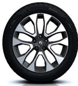
Aluminijski naplatci 19" Proteus