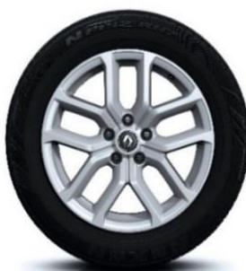
Aluminijski naplatci 18" Taranis