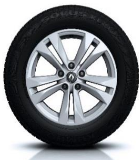
Aluminijski naplatci 17" Esqis